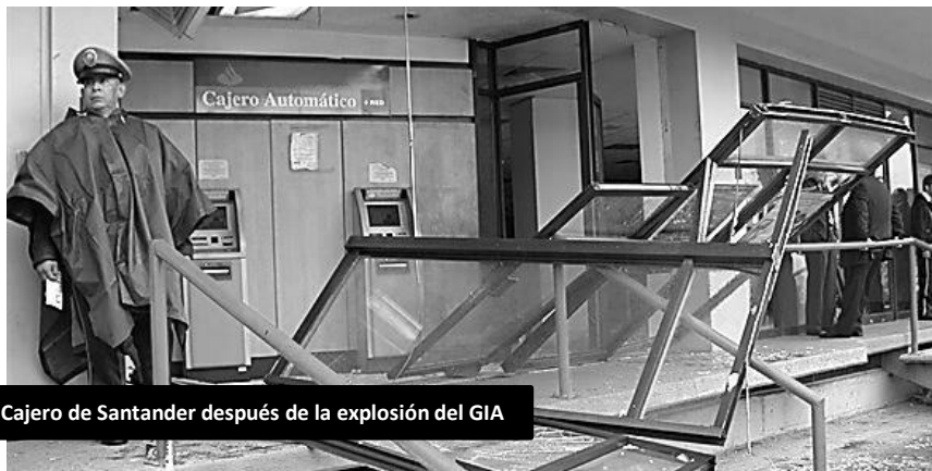
Cajero de Santander después de la explosión del GIA

1) Reproducimos el comunicado del “Grupo Informal Anti-civilización”, en el texto se hace alusión a la “solidaridad promiscua”, se nota a leguas la tendencia “eco-anarquista anti-dominadora” que profesaban, dos cosas que el grupo ha dejado atrás al pasar de los años y al unirse a Reacción Salvaje .