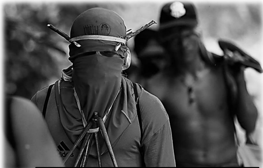
Aborígenes ka'apor toman las armas para defender la selva en Brasil.

En esta entrega número seis de “Pablaras Nocivas” publicamos el comunicado íntegro del grupo terrorista “Reacción Salvaje” (quien fuera antes Its), así como varias notas donde publicamos los comunicados pasados de los grupos que ahora lo integran. Tuvimos la libertad de corregirlos ortográficamente, de sintaxis, quitarles las “x” que antes usaban, etc., pero los hemos dejado así, pues dichos “defectos” son parte integral de la evolución que han tenido desde que eran “eco-anarquistas”, después “anti-civilización” y ahora terroristas salvajes.