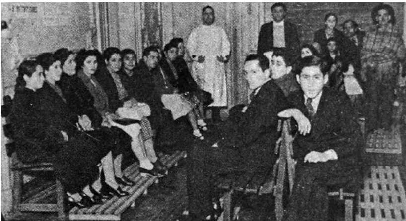
1940. Policlinico IWW.