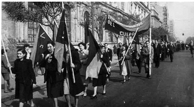
1949. Obreros y obreras del calzado en el Primero de Mayo.