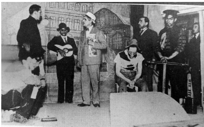
1940. Cuadro Dramático Luz y Armonía.

mingo Gómez Rojas (Santiago, 1935), Conjunto Artístico Libertario de Estucadores (Santiago, 1935), Conjunto Artístico Lux (Santiago, 1935), Conjunto Teatral Minerva (Santiago, 1935-1947), Grupo Teatral España Nueva (Santiago, 1937), Cuadro Artístico Federica Montseny (Santiago, 1937-1938), Conjunto Hijos del Pueblo (Osorno, 1937-1939), Compañía de Arte Social Camilo Berneri (Santiago, 1938-1940), Conjunto Rosa Roja (Santiago, 1936-1941), Conjunto Artístico Pasionaria (Santiago, 1938), Conjunto Artístico La Lira-IWW (Santiago, 1938), Orfeón Hijos del Pueblo (Santiago, 1939), Escuela Musical Libertad (Santiago, 1940-1943), Conjunto Artístico Libertad (Santiago, 1940-1941), Conjunto Artístico Juan Gandulfo (Santiago, 1941), Conjunto Carlos Barella-URE (Valparaíso, 1941) y el Conjunto Artístico Zapateros CGT (Santiago, 1941).