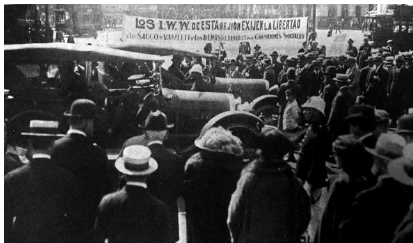
1923. Manifestación en Santiago por Sacco y Vanzetti

Se acordó trabajar en pro de una huelga general nacional dentro de los próximos treinta días para impulsar la reforma 99 . Como la concurrencia al encuentro era heterogénea y se necesitaba mantener una relación estrecha con los asalariados, la AGP acordó quedarse con las organizaciones afines, excluyendo aquellos que “sustenten o estén afiliados a colectividades políticas”. Tal medida selló la unión de los profesores con los libertarios, al tiempo en que les separó de los comunistas 100 .