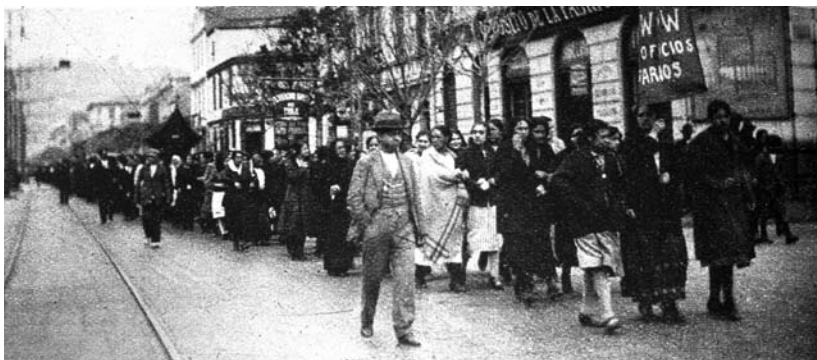
1924. Valparaíso. Huelga IWW

El acuerdo sobre la futura huelga general y otras mociones aclamadas (Estudio del esperanto, inclusión de las familias al proceso de enseñanza, vinculación de los profesores a las organizaciones sociales, guerra al analfabetismo), más algunos hechos precedentes como la negativa de los profesores de hacer participar a los niños en actos patrióticos, crearon una terrible imagen sobre los profesores. De hecho, la prensa conservadora con El Diario Ilustrado a la cabeza, realizó una persistente campaña en su contra. Y tras la Convención de Mayo siete dirigentes de la AGP fueron exonerados.