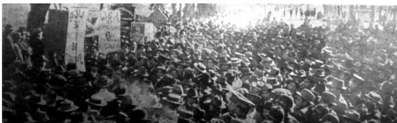
1914. Santiago Liga de Arrendatarios

El 17 de marzo entró en vigencia la Ley de Tribunales de Vivienda. El 8 de abril los anarquistas de Santiago coordinaron una huelga general por los arriendos. Los comunistas no participaron y crearon un “Consejo federal de arrendatarios” que se manejó en los términos de la Ley. Los libertarios señalaron que los grupos políticos intentaban levantar caudillos electorales al buscar conquistar los cargos representativos de los inquilinos en los Tribunales de Vivienda.