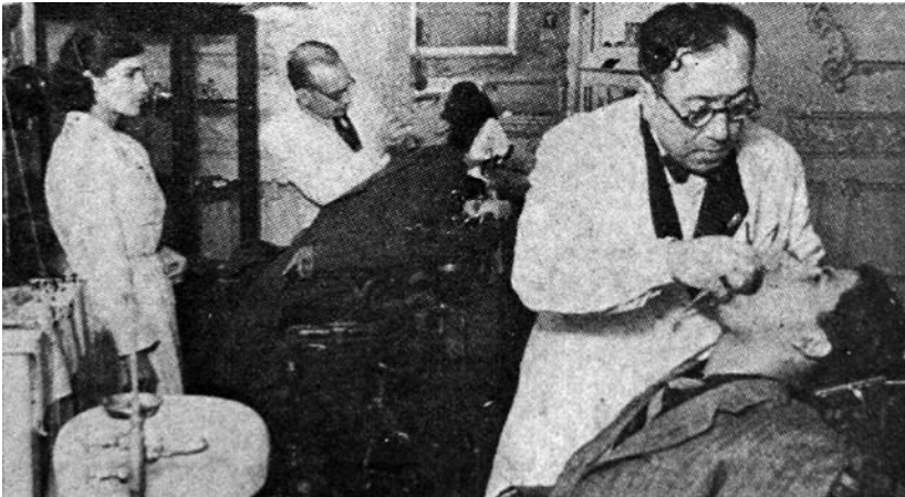
1940. Policlinico IWW.

El policlínico también se había auto asignado una tarea de difusión. Y para ello editó durante años una Hoja Sanitaria IWW , publicación sin costo de dos mil ejemplares orientada a propagar la higiene y evitar las enfermedades a los trabajadores y sus familias 808 . El policlínico y la publicación eran coordinadas por un Comité Sanitario IWW. Esa organización ayudaba financiando parte de los gastos. Los médicos por lo general no cobraban por su trabajo.