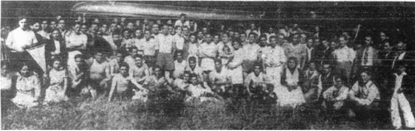
1943. Deportivo Andamio, Picnic en Concepción.

de enero de 1926, en donde se recomienda a los trabajadores y sus familias estudiar y asumir la procreación consciente 793 .