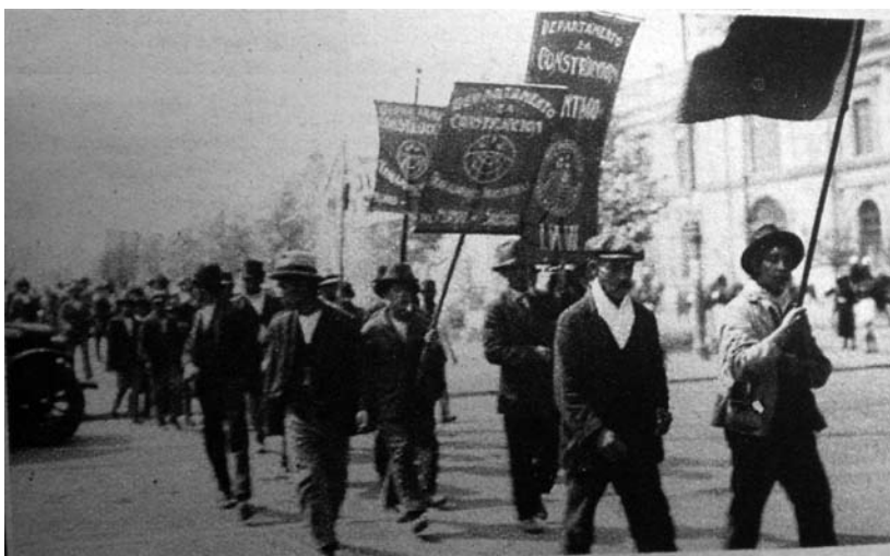
1924, Huelga IWW en Santiago