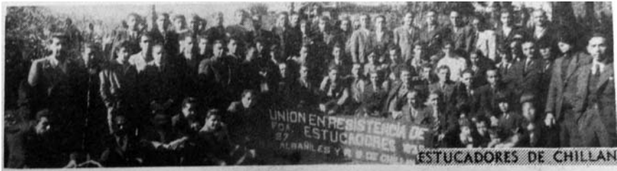
1941. Unión en Resistencia de Estucadores de Chillán.

Tras la caída de la Dictadura, el sindicato retornó a su tendencia anarcosindicalista y en consecuencia se sumó a la CGT. Hay que remarcar no obstante que en su interior seguían existiendo corrientes contrarias a la “dirección” libertaria 541 . El despertar sindicalista tras los cuatro años de sistemática represión hizo que entre 1931 y 1932 se desatara una gran ola de paralizaciones parciales 542 . En ese contexto la Unión en Resistencia de Estucadores logró implantar la jornada de 6 horas en algunas obras fiscales de la capital (Tribunales de Justicia, Museo Histórico, Escuela de Ingeniería, Biblioteca Nacional) en noviembre de 1931. Nuevamente fueron los primeros en lograr una victoria de ese tipo 543 . La Unión General de Laboradores en Madera lo hizo en noviembre de 1932 544 . En mayo de 1935 la URE impuso nuevamente las 6 horas en tres obras de Santiago 545 .