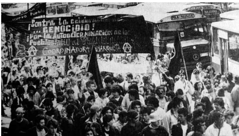
1990. Manifestación del 4 de septiembre.

Con todo hay que señalar que la unidad de los anarquistas no siempre fue un tema trascendental para el heterogéneo movimiento libertario. Más bien apareció al tiempo en que su actividad iba en retroceso frente a los partidos políticos que con sus estructuras centralizadas tenían más éxito que los anarquistas para mantener posturas uniformes. Las divergencias de opinión y acción son propias al anarquismo. Ello les dio dinamismo en varios contextos, puesto que al ser cada esfuerzo autónomo había más espacio para la libre iniciativa, por ejemplo. Pero eso mismo les jugó en contra para sostener su influencia en los sindicatos, puesto que no poseían una organización duradera que les sirviera de apoyo frente a las disputas con los partidos políticos de izquierda.