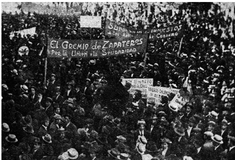
1918. Valparaíso. Primero de Mayo.

del Estado 588 . De ahí en adelante muchas de las luchas del gremio se canalizarían a través de la implantación y defensa del tarifado que se renovaba periódicamente. En muchos de esos conflictos los zapateros libertarios actuaron unidos a los sindicatos orientados por otras corrientes políticas, como la Federación Industrial del Calzado (FIC) 589 .