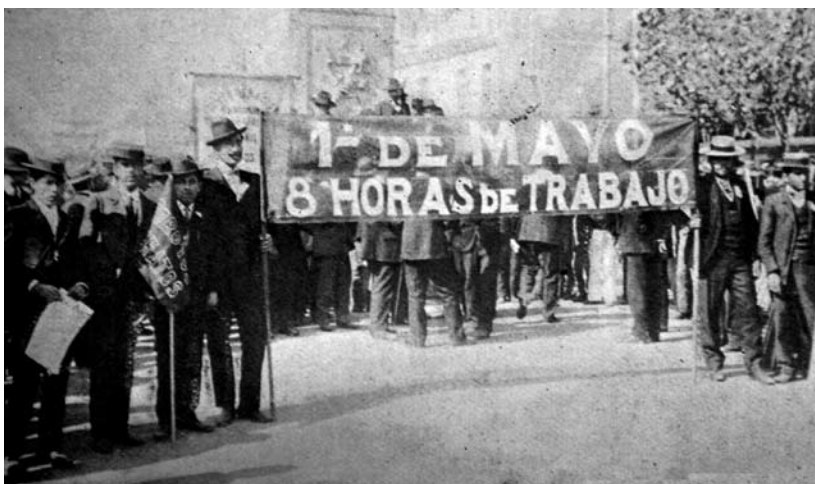
1913. Obreros exigen jornada de 8 horas.