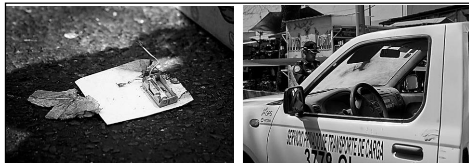
Izquierda: Parte del paquete-bomba depositado por Its, y abierto por un imprudente empleado postal.