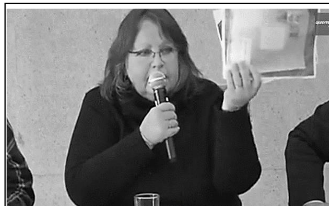
Directora de Greenpeace México, mostrando una foto del paquete-bomba enviado por ITS