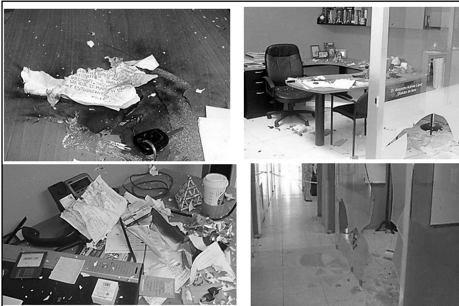
Fotos del atentado al Tec de Monterrey.

-Agosto de 2012: Un paquete bomba es enviado a los neurocientíficos de Instituto Tecnológico Autónomo de México (ITAM), en la Delegación Álvaro Obregón en DF. Este acto