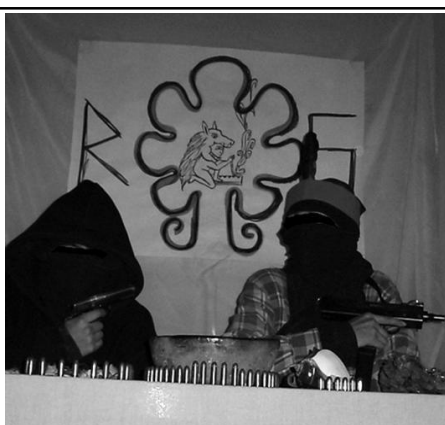
Una de las fotos que fueron publicadas en el primer comunicado del grupo Reacción Salvaje, en Agosto de 2014

Según el comunicado, en donde se aprecian dos individuos encapuchados armados con pistolas cortas, una ametralladora y un altar a la naturaleza, Reacción Salvaje tiene presencia en DF, Estado de México, Hidalgo, Morelos, Guanajuato, Aguascalientes, Zacatecas, Veracruz, Coahuila, Puebla y Michoacán.