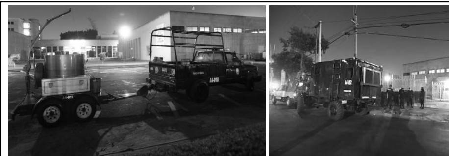
Policía especializada en explosivos del DF, retirando bomba dentro del Instituto Nacional de Psiquiatría

-15 de Diciembre de 2011: Es recibido por medio de un mail, al Instituto Nacional de Psiquiatría “Ramón de la Fuente”, la amenaza de detonar un carro bomba que se encontraba estacionado dentro del instituto, se genera todo un operativo policial, al percatarse que un auto con parecidas características (placas, modelo, color, etc.), realmente se encontraba ahí. La policía antiexplosivos decide llevarse el auto completo para examinarlo en su cuartel. Los ataques contra este instituto se las atribuiría más tarde, el grupo terrorista NS – Fera – Kamala y Amala.