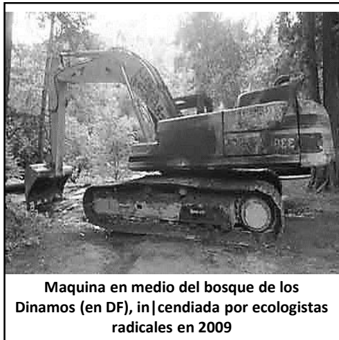
Maquina en medio del bosque de los Dinamos (en DF), incendiada por ecologistas radicales en 2009

En defensa de la naturaleza salvaje: “Ediciones Aborigen” Septiembre 2014