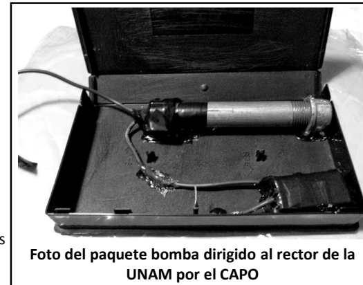
Foto del paquete bomba dirigido al rector de la UNAM por el CAPO

-11 de Junio de 2014: Sale a la luz la revista Palabras Nocivas n° 5 de “Ediciones Aborigen”, los escritores se unen al llamado de la creación de grupos de corte terrorista en defensa de la naturaleza salvaje, advierten que ellos antiguamente formaban parte de las “células liberacionistas y ecoanarquistas” más activas de la zona centro de México, durante 2008 hasta 2012, y que están familiarizados con el ataque, prometiendo que retomaran de nuevo las viejas herramientas pero ahora en contra de un objetivo más central: el sistema tecnoindustrial.