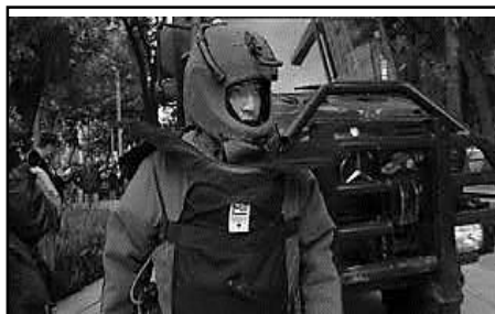
Escuadrón antiexplosivos dentro de la UPP de Hidalgo, después de que un investigador resultara herido por un explosivo enviado por Its