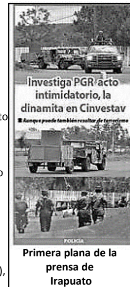
Primera plana de la prensa de Irapuato

-7 de Septiembre de 2011: Un sobre de paquetería simulado, es encontrado en un centro de investigación de la Facultad de Estudios Superiores (FES) de la UNAM, campus Cuautitlán en el