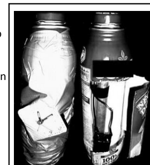
Foto del segundo artefacto de Its, contra la nanotecnología