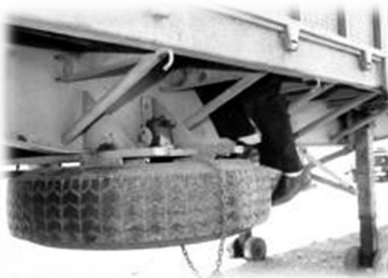
Escondite Los presos fugados entraron de esta manera en el camión que les llevó a Navarra.

Linternas fabricadas a base de rollos de papel higiénico, la continuada extracción de tierra que iba a parar a la cocina, turnos de vigilancia ininterrumpidos también durante las noches, partidos a pala y simulados arreglos de mobiliario para que no detectaran los ruidos provenientes de la excavación, o la colocación de una tapadera falsa de 40 kilos en el comienzo del túnel, fueron algunos de los necesarios trabajos previos al día de la fuga.