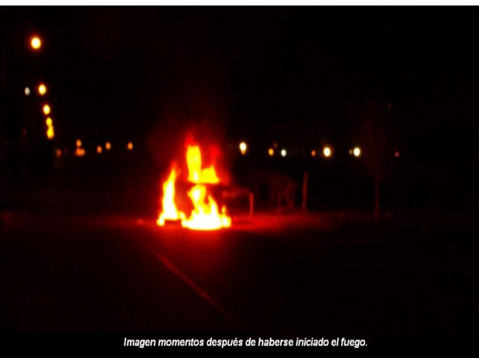
Imagen momentos después de haberse iniciado el fuego.

FAI/FRI – GCROI \ CÉLULA DE ACCIÓN ICONOCLASTA-INSURRECCIONAL.