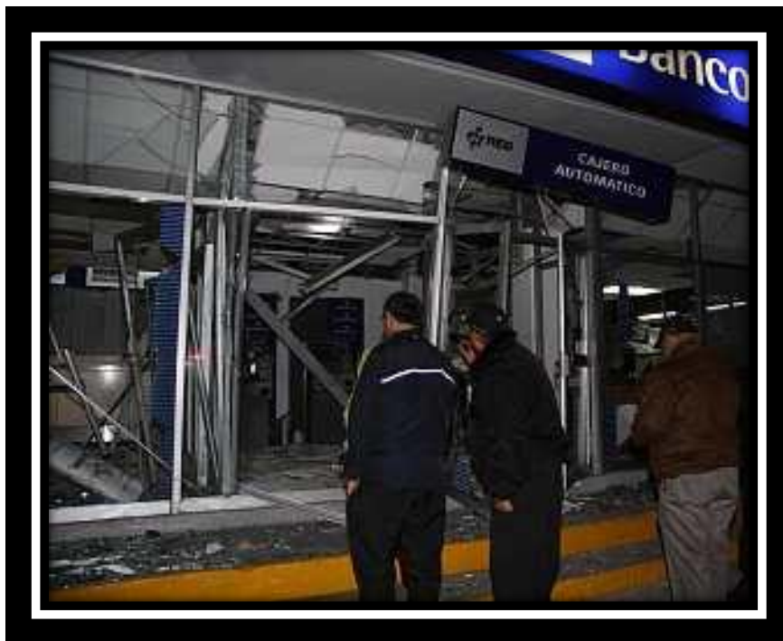
Foto: Banco de Toluca, Estado de México. tras la explosión de una bomba el pasado 31 de diciembre del 2009, reivindicado por las Brigadas de acción revolucionaria por la propaganda por el hecho y la acción armada "Simon radowsky" / comando de ajusticiamiento 25 de Mayo de 1910

Sabemos muy bien que pueden existir personas que simpaticen con las acciones o con nuestros sabotajes, que al ver que el banco que les ha robado más de media vida quedo bien destruido o bien incendiado sentirán algo de placer o felicidad, pero también sabemos muy bien que aunque estas personas puedan haber, en momentos de verdaderos aprietos los únicos que darán la cara por nosotrxs serán nuestrxs compañerxs de afinidad estén cercas o estén en la lejanía de la geografía de este planeta, en ellxs confiamos al 100%, ¿porque?, porque lo han demostrado con hechos no solo con palabras.